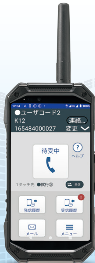
MCAアドバンス無線機 携帯型端末 KC-PS701 ＜京セラ株式会社製＞